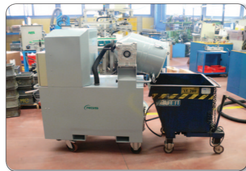
更便捷的垃圾处理方式